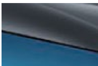
Surfing blue + Urban grey