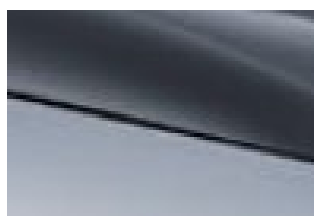
Skiing white + Urban grey