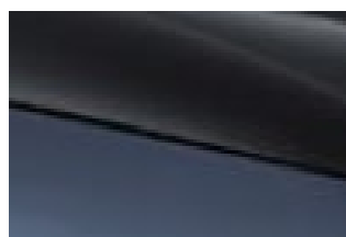
Atlantis grey + Jet black